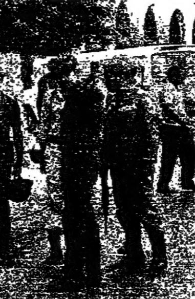
مجموعة من رجال الامن ترصد نشاط القاصية في بيروت